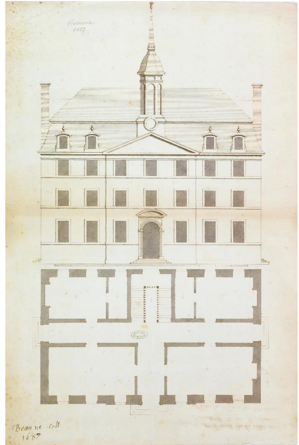
Louis Trestournel Plan et élévation du collège de l'oratoire de Beaune, 1687, Archives nationales, Cartes et plans N III Cote d'Or 8-1

A la fin du XVII e siècle, les Oratoriens font entreprendre des travaux de reconstruction du Collège qui lui donnent la physionomie que l'on lui connaît encore, avec sa célèbre chapelle 9 . On connaît assez bien la vie du Collège au XVIII e siècle (Joseph Délissey en a fait de nombreux articles 10 ) ainsi que les élèves célèbres à l'instar de Gaspard Monge qui lui donna son nom.