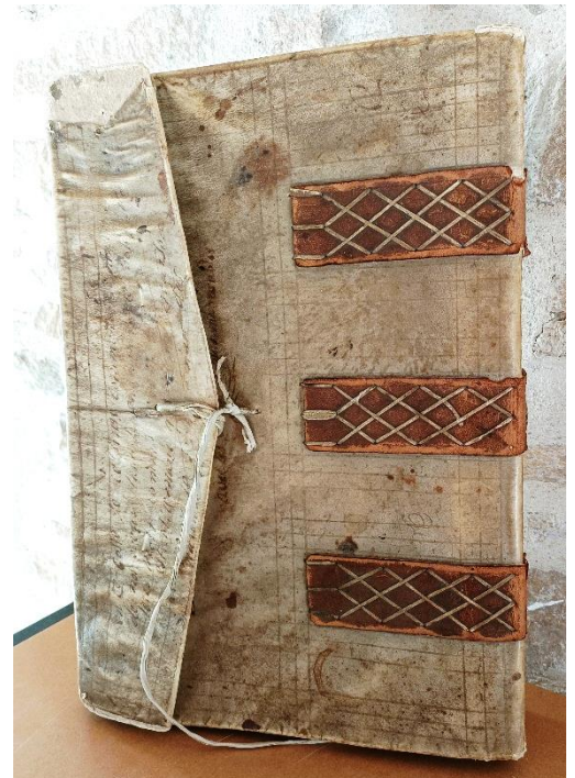
La belle couverture avec son rabat.

L'ouvrage qui est d'un beau papier chiffon (il sera également dépoussiéré), est en deux parties qui se repèrent par l'indication portée sur la couverture : « En ce costé commence l'entrée et la mort des sœurs de cet Hôpital ». Le registre en lui-même débute par le récit de l'installation de la communauté à Dole le 21 novembre 1663.